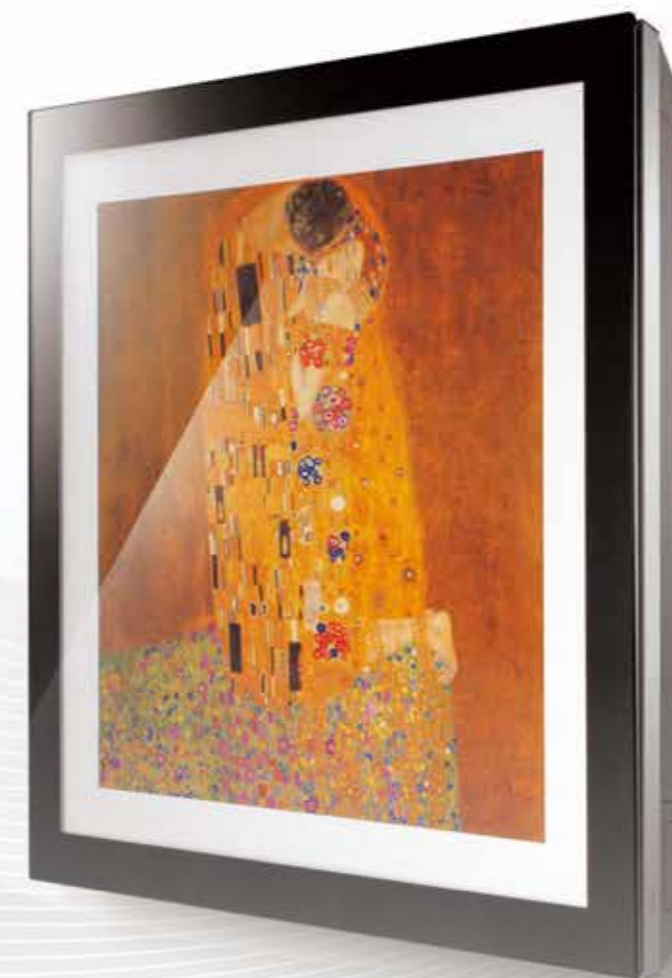
ARTCOOL Gallery R32 Wi-Fi DUAL Inverter Google Assistant

LG biedt het hele jaar door optimaal comfort en uitstekende luchtkwaliteit