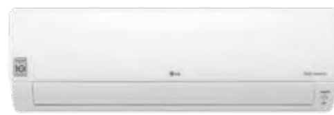
Deluxe Wi-Fi R32 DUAL Inverter Google Assistant