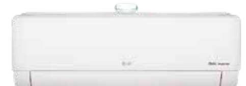
Air Purification Wi-Fi R32 DUAL Inverter Google Assistant