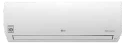
Prestige Wi-Fi R32 DUAL Inverter Google Assistant