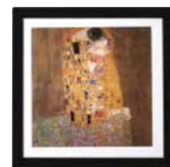
ARTCOOL Gallery Wi-Fi R32 DUAL Inverter Google Assistant